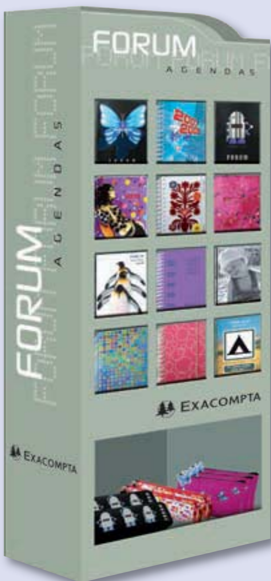
Photo non contractuelle - Suggestion de présentation