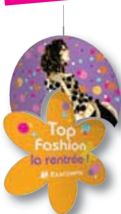
28402E Miss Forum